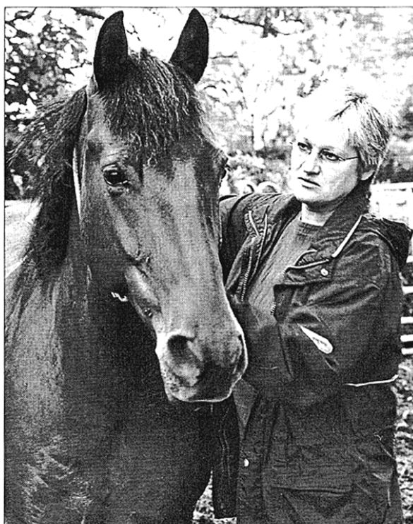
Das Zusammenspiel von Patient, Besitzer und der Therapeutin ist enorm wichtig, Lobo zeigt sehr schön seine Bereitschaft zur Mitarbeit.